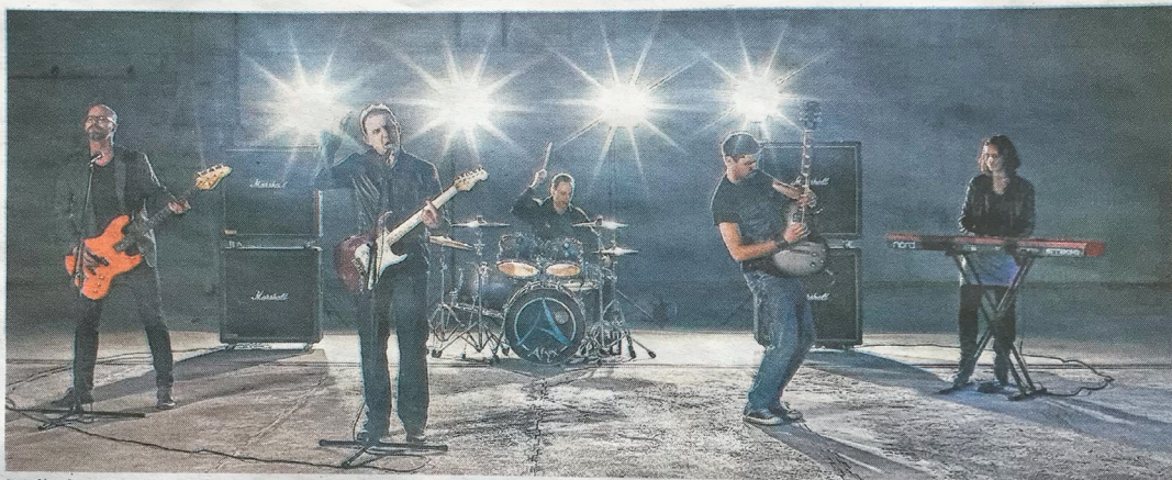
Le clip du premier single éponyme de « Vole » a été tourné dans le home-studio du groupe à Yverdon en Suisse.